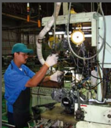
Στο τέλος της γραμμής, συνδέονται το καρμπυρατέρ, η εξάτμιση και τα ηλεκτρικά, και μέσα σε ελάχιστο χρόνο ο τεχνικός της φωτογραφίας ελέγχει αν ο κινητήρας τηρεί τις προδιαγραφές