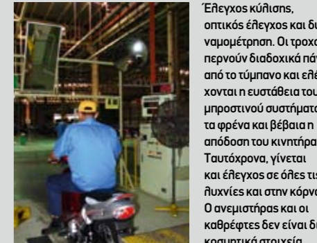
Έλεγχος κύλισης, οπτικός έλεγχος και δυναμόμετρηση. Οι τροχοί περνούν διαδοχικά πάνω από το τύμπανο και ελέγχονται η ευστάθεια του μπροστινού συστήματος, τα φρένα και βέβαια η απόδοση του κινητήρα. Ταυτόχρονα, γίνεται και έλεγχος σε όλες τις λυχνίες και στην κόρνα. Ο ανεμιστήρας και οι καθρέφτες δεν είναι διακοσμικά στοιχεία...