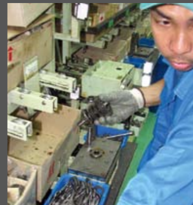
Συναρμολόγηση κιβωτίου. Μέσα σε ελάχιστα δευτερόλεπτα, και σχεδόν στα τυφλά, ο κύριος της φωτογραφίας συναρμολογεί ένα ολόκληρο κιβώτιο ταχυτήτων, από το μηδέν. Ο γρηγορότερος του εργοστασίου και με διαφορά!