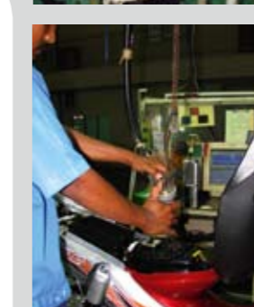
Αφού όλα τα στάδια ολοκληρωθούν, προστίθεται λίγο καύσιμο και το κάθε παπί οδηγείται στο δυναμόμετρο