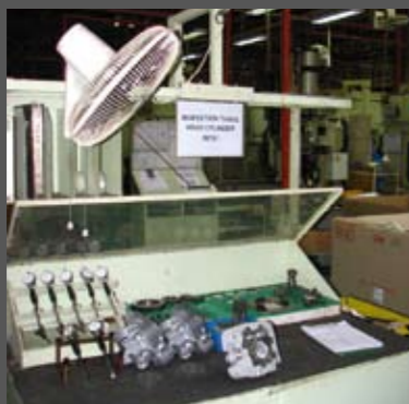
Τα περισσότερα εξαρτήματα του κινητήρα, δειγματοληπτικά, περνούν και από ανθρώπινο έλεγχο. Η ζέστη, είναι κάτι που δύσκολα μπορείς να καταπολεμήσεις στους ακανείς χώρους ενός εργοστασίου, πόσο μάλλον όταν αυτό βρίσκεται στην καυτή Μαλαισία. Απαραίτητο αξεσουάρ, ο ανεμιστήρας...