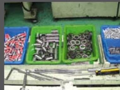
Βρισκόμαστε στο στάδιο όπου "κλείνουν" τα κάρτερ του κινητήρα. Σε πρώτο πλάνο, βίδες και εξαρτήματα "πρώτης γραμμής", που φτάνουν έτοιμα στο εργοστάσιο. Οι βίδες στα αριστερά, είναι οι "κόντρες" του ελατηρίου του επιλογέα ταχυτήτων. Το κόκκινο είναι κόλλα. Πιο δεξιά βλέπουμε spacers και ατσάλινες, παχιές ροδέλες για την καμπίνα του συμπλεκτή. Στα δύο μικρά μπλε δοχεία, διακρίνονται οι κατασβιδόβιδες που σφίγγουν τα κάρτερ, ενώ από κάτω τις σφίνες του βολάν