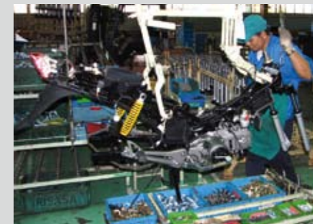
Βρισκόμαστε στην τελική γραμμή παραγωγής. Πρώτα τοποθετούνται η πλεξούδα και το κεντρικό στάντ. Αμέσως μετά ο κινητήρας και στη συνέχεια οι αναρτήσεις, οι τροχοί, το τιμόνι, τα περιφερειακά και τα πλαστικά. Εξαιρετικά ενδιαφέρουσα είναι η διαδικασία τοποθέτησης των ρουλεμάν του πλαίσιου. Σε δεύτερο πλάνο διακρίνονται οι "χύμα" μπιλίτες. Με τη βοήθεια ενός μαγνήτη και αρκετού γράσου, με ελάχιστες κινήσεις τοποθετούνται στη θέση τους