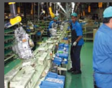
Γραμμή συναρμολόγησης κινητήρα. Ο κάθε εργαζόμενος έχει στη διάθεσή του συγκεκριμένο χρόνο και χώρο. Οι βάσεις όπου τοποθετούνται οι κινητήρες, αφού "κλείσουν" τα κάρτερ, έχουν τρισδιάστατη δυνατότητα κίνησης, διευκολύνοντας απίστευτα τη διαδικασία της συναρμολόγησης