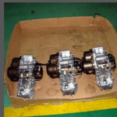
Αντίθετα, αυτοί οι τρεις απέτυχαν. Θα οδηγηθούν σε ένα ειδικό τμήμα του εργοστασίου, όπου θα αποσυναρμολογηθούν και θα επισκευαστούν. Το 99% των περιπτώσεων, οφείλεται σε προβληματικά ρουλεμάν. Πάνω στα χάρτινα ταμπλάκια, αναγράφονται τα ακριβή σκόλια του δοκιμαστή