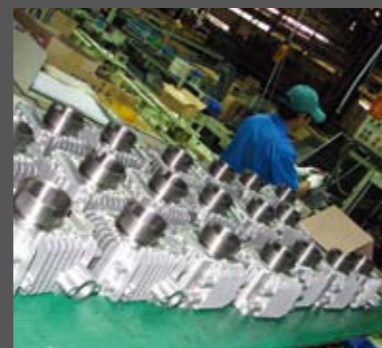
Αερόψυκτοι τετράχρονοι κύλινδροι, έτοιμοι και φρεσκοβαμμένοι, αναμένουν καρτερικά το στάδιο του ρεκτιβί