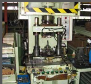
Σε αυτήν την υδραυλική πρέσα, πρεσάρονται τα ρουλεμάν και το γρανάζι της καδένας του εκκεντροφόρου, πάνω στον στρόφαλο. Αμέσως μετά, ακουμπεί το ζύγισμα