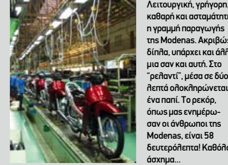
Λειτουργική, γρήγορη, καθαρή και ασταμάτητη, η γραμμή παραγωγής της Modenas. Ακριβώς δίπλα, υπάρχει και άλλη μια σαν και αυτή. Στο "ρελιαντί", μέσα σε δύο λεπτά ολοκληρώνεται ένα παπί. Το ρεκόρ, όπως μας ενημέρωσαν οι άνθρωποι της Modenas, είναι 58 δευτερόλεπτα! Καθόλου άσχημα...