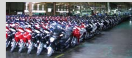
Στοιχισμένα, φρεσκοβαμμένα και πεντακάθαρα, μερικές εκατοντάδες παπιά περιμένουν να αναχωρήσουν από το εργοστάσιο της Modenas

με τα δικά μας δεδομένα), και είναι σχετικά αποκομμένο από την κοντινότερη πόλη ή χωριό της περιοχής. Η κτιριακή υποδομή του εργοστασίου ολοκληρώθηκε πριν από δώδεκα χρόνια, άρα μπορούμε να μιλάμε για ένα καινούριο, σύγχρονο κτίριο. Στον ίδιο χώρο και σε παραπλήσια κτίρια με του κυρίως εργοστασίου, βρίσκονται συγκεντρωμένα και όλα τα γραφεία της εταιρείας. Οι βιομηχανικοί τομείς χωρίζονται σε μεγάλα τμήματα που βρίσκονται σε ανεξάρτητα κτίρια μεταξύ τους, ανάλογα με τις διαδικασίες παραγωγής, όπως η "βαφή", η "συναρμολόγηση κινητήρων" και η "τελική γραμμή παραγωγής". Όλοι οι τομείς λειτουργούν αυτόνομα, παράγουν ταυτόχρονα εξαρτήματα για πολλά διαφορετικά δίκυκλα, είναι όμως συντονισμένοι σε έναν σχετικά παραπλήσιο ρυθμό.