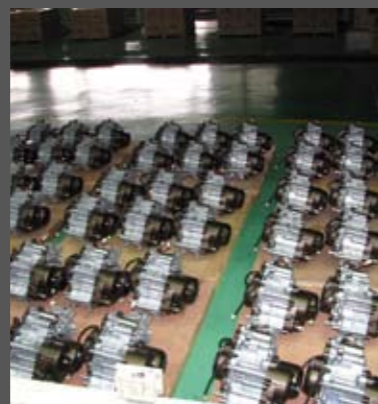
Όλοι οι κινητήρες, αφού συναρμολογηθούν και δοκιμαστούν, συγκεντρώνονται σε έναν ειδικό χώρο, και στη συνέχεια μεταφέρονται στη γραμμή τελικής συναρμολόγησης. Οι συγκεκριμένοι έχουν περάσει επιτυχώς τον έλεγχο