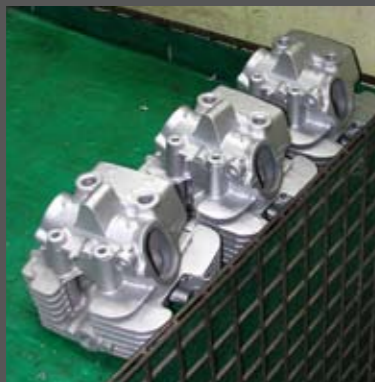
Τρεις αφινιριστές κεφαλές περιμένουν τη σειρά τους για επεξεργασία. Σε λίγα λεπτά θα έχουν αποκτήσει έδρες βαλβίδων, σπειρώματα και διόδους λαδιού