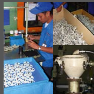
Εδώ κατασκευάζονται τα πλαστικά εξαρτήματα του κινητήρα, και στη συγκεκριμένη φάση, το πλαστικό γρανάζι της τράμπας λαδιού. Το πρωτογενές υλικό είναι σε στεγνή μορφή. Το περίεσομα, και τα καλούπια, ξαναχρησιμοποιούνται. Ο τεχνικός τοποθετεί τον μεταλλικό άξονα στο κέντρο του γραναζιού